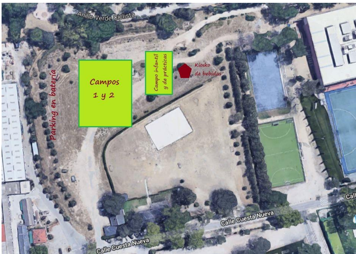
Fig. 1 – Campos de cróquet: Ubicación orientativa

El siguiente croquis, meramente ilustrativo, muestra la ubicación que proponemos. No se trata de un mapa a escala, y así debe ser interpretado.